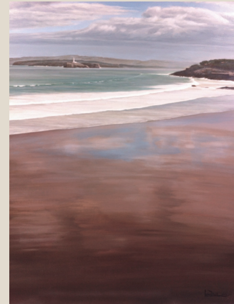
“BAJAMAR EN LA PRIMERA”