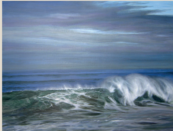
“OLA ROMPIENDO” (135x90). Acrílico-óleo.

Quizás –sóloamente “quizás” – el auténtico arte se encuentre en atreverse a añadir algo personal que te identifique y distinga de tanta mediocridad, sin deteriorar o devaluar la imagen que te cautiva. Pero, yo no sé si es que no me atrevo a hacerlo, si no acierto, o si es algo imposible de conseguir.