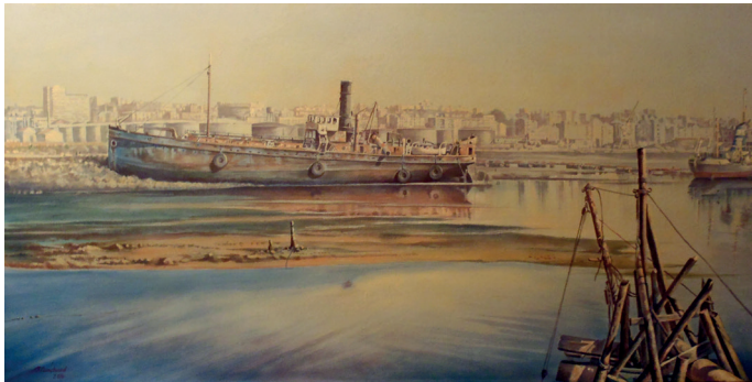
“DRAGA SOMO” (122x81). Acrílico.

Es el resultado de un proceso de construcción mental, pues la pintura se construye en la mente y, más tarde, pasa a ser actividad mecánica y artesanal.